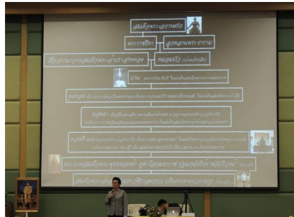
บรรยายเรื่อง ประวัติศาสตร์ชาติไทยความเสียสละของบูรพมหากษัตริย์ไทยในยุคกรุงสุโขทัยกรุงศรีอยุธยากรุงธนบุรี