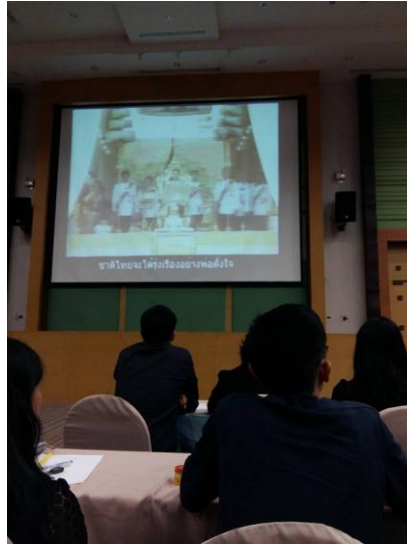
บรรยายเรื่อง หลักและสิ่งที่ทำให้ประเทศไทยยังเป็นไทยอยู่จนถึงทุกวันนี้