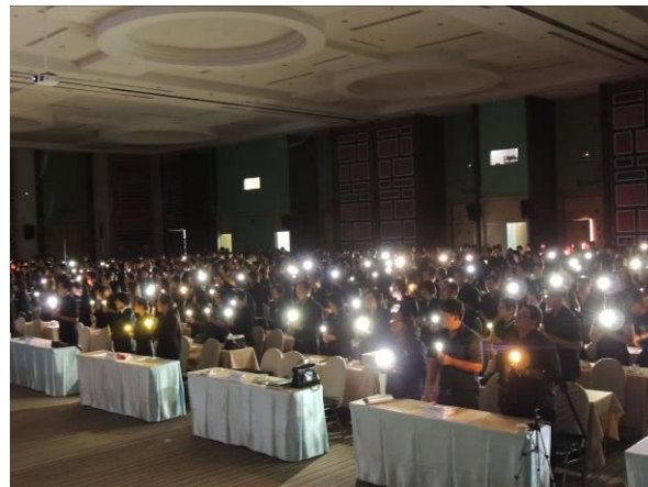
พิธีเทียนสถาบัน