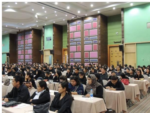
บรรยายเรื่อง ประวัติศาสตร์ชาติไทย ความเสียสละของบูรพมหากษัตริย์ไทย ในยุคกรุงรัตนโกสินทร์ (รัชกาลที่ 1-8)